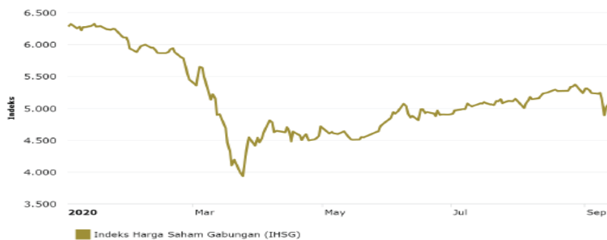
Gambar 1. Composite Stock Price Index

menimbulkan gejolak dan pengaruh dari reaksi investor, termasuk situasi pasar di Bursa Efek Indonesia secara keseluruhan. Dalam bertransaksi di BEI, investor sangat membutuhkan data historis pergerakan saham untuk mengetahui pergerakan indeks saham. Pergerakan tren di pasar berfungsi untuk menentukan apakah pasar naik atau turun. Jika pergerakan saham menunjukkan penurunan maka indeks saham di pasar juga menurun, dan jika pergerakan saham meningkat maka indeks saham akan meningkat. Harga saham gabungan atau biasa dikenal dengan Indeks Harga Saham Gabungan (IHSG) merupakan indeks sektoral yang digunakan sebagai alat tujuan investasi. Jika IHSG mengalami kenaikan, maka perekonomian Indonesia akan berada dalam siklus yang baik. Penurunan kenaikan harga saham gabungan selalu terjadi dari waktu ke waktu (Desica Sibarani, 2019).